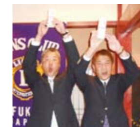
4月の誕生ライオン