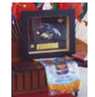
台湾からのお土産