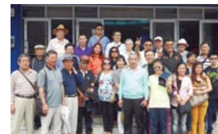
参加した岐阜北ライオンズクラブメンバー