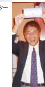
ダブルで商品券もゲット!