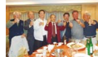
歓迎夕食会でカンパイ