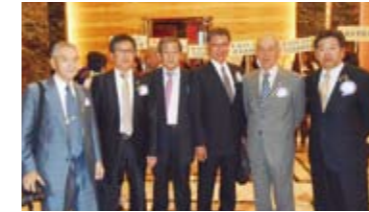
参加した岐阜北ライオンズクラブメンバー