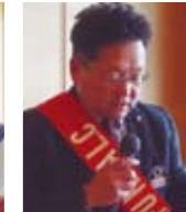
テールツイスターの 報告