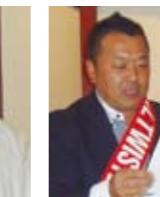
テールツイスター の報告