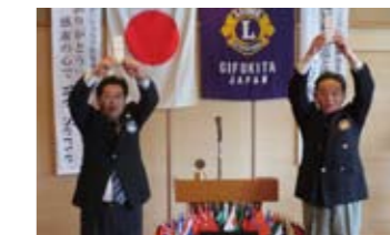
4月の誕生ライオン