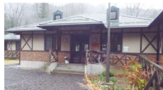
あいにくの雨のため、四季の森センターにて例会をおこなう。