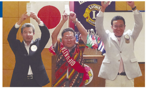
10月生まれのライオン達