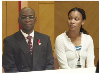
来賓のMr.カクとお嬢様