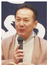
美濃流し仁輪加 による余興