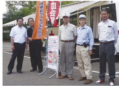
献血活動 岐阜女子大学 10月12日(土) 9:00～