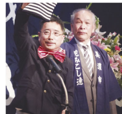
Mr.マッコリが手品を披露