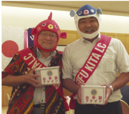
お気軽ファインの テール・ツイスターコンビ