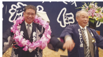
輪になって歌う両会長